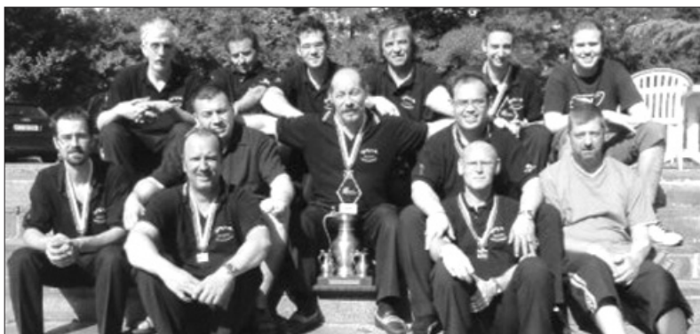
BC MIAMI Lausanne